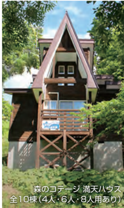
森のコテージ 満天ハウス 全10棟(4人・6人・8人用あり)