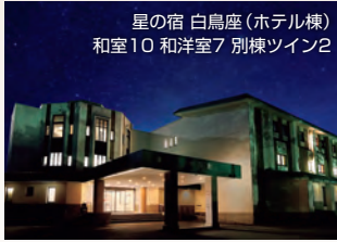
星の宿 白鳥座(ホテル棟) 和室10 和洋室7 別棟ツイン2