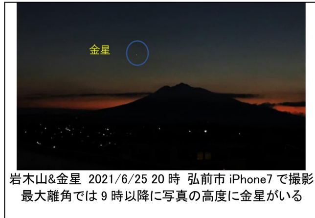
岩木山&金星 2021/6/25 20時 弘前市 iPhone7で撮影 最大離角では9時以降に写真の高度に金星がいる

夕方西の空に明るく輝く金星、『宵の明星』。今月の4日に東方最大離角となり、22時近くまで金星を見ることが出来ます。